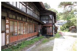
名旅館の歴史と面影を伝える建物

みょうごう ヒュッゲ 川崎町青根温泉4-4 TEL.0224-86-4553 木・金・土曜 11:00～19:00 日曜 11:00～17:00 月・火・水曜定休