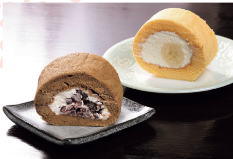
ふんわりしたロールケーキ2種(ほうじ茶のあずきクリーム、バナナ)