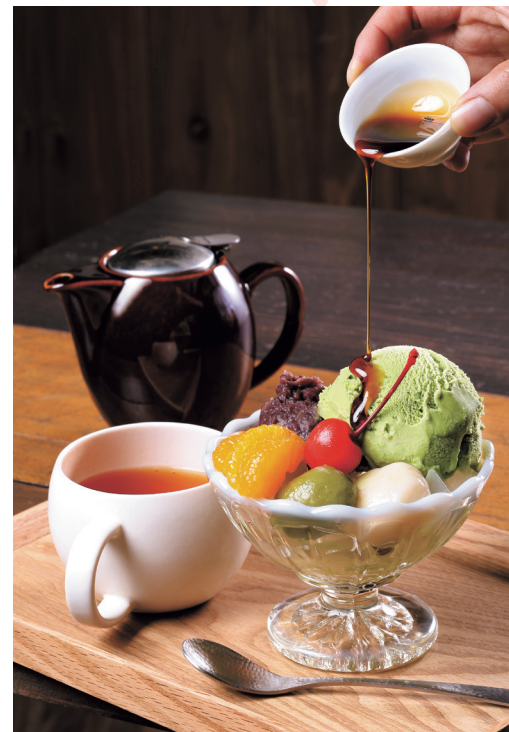
自家製あんこと自家製白玉を使った「白玉クリームあんみつ」