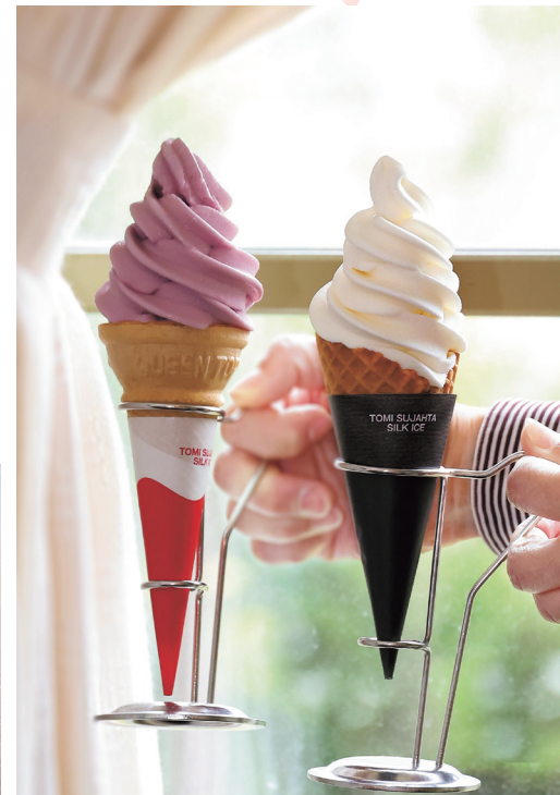
北海道産生クリーム100%の「プレミアムバニラ(400円)」と「巨峰(350円)」のソフトクリーム