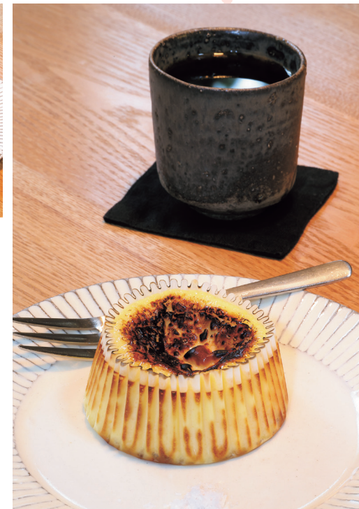
なめらかで濃厚な味の「バスクチーズケーキ」と「ブルーマーカー」