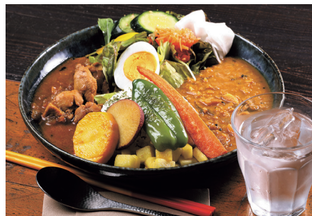
豆カレーとチキンカレー両方が味わえる「スパイスカレーあいがいけ」