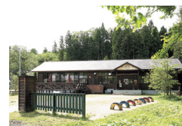
昭和初期の木造校舎を再現した建物

川崎町大字前川字松葉森山6-5 TEL.0224-86-4678 平日 10:00~16:00(L.O.15:30) 土・日・祝日 10:00~17:00(L.O.16:30) ※生地がなくなり次第終了 火曜定休