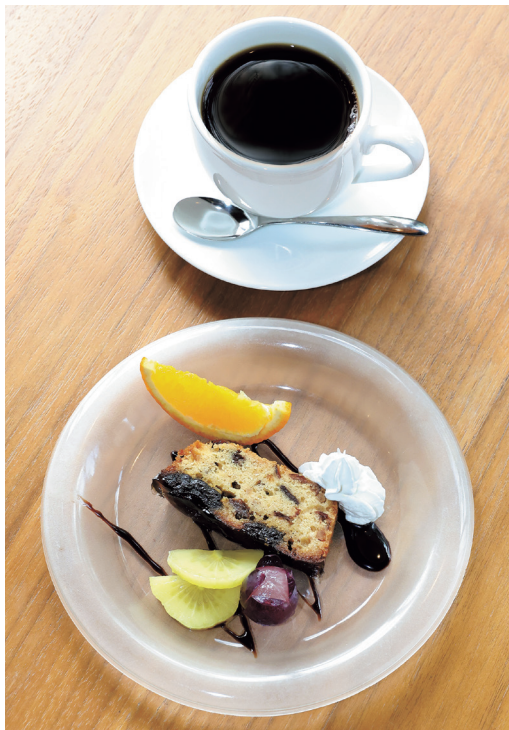
蔵王食工房 アトリエデルスの「ブリューノ」と「ブレンドコーヒー」