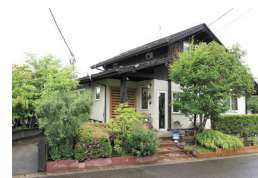
草木や菜園、自作の看板にほっこり

川崎町支倉台1-19-14 TEL.090-2980-1905 9:00～16:00 不定休