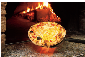
イタリアの石窯で熟練者が香ばしく焼き上げる