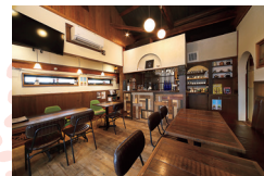
家族でDIYに取り組んだ古民家風の店内