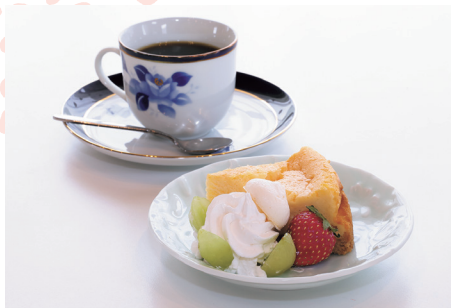
フルーツとクリームが添えられた日替わりケーキはコーヒーとセットで