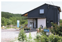
空と緑、草花が迎えてくれるカフェ

ガーデン カフェ ソラ 川崎町大字川内字朴ノ木山1-1 TEL.090-7832-0833 10:30~16:30 水・木曜定休 ※定休日でも3名以上は予約可(11:00~15:00、ランチのみ)