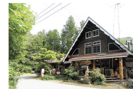
緑に囲まれた三角屋根のログハウス

川崎町大字今宿字焼橋沢山1 TEL.0224-84-4843 11:30~19:00(L.O.18:30) 火曜定休(火曜祝日の場合営業) 不定休あり