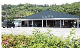
屋根付きのイートインスペースも設置

川崎町大字小野字弁天29-1 TEL.0224-87-6623 9:00~17:00 テイクアウトは10:00~16:00 火・水曜はテイクアウトのみ休み ※冬期(12月中旬~2月末ごろ)休業