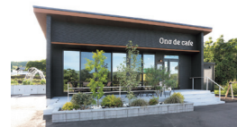
国道286号沿いにある黒壁のモダンな外観