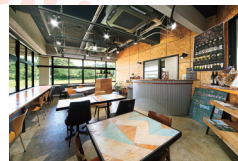
窓際カウンターがある店内は旧職員室を改装したもの