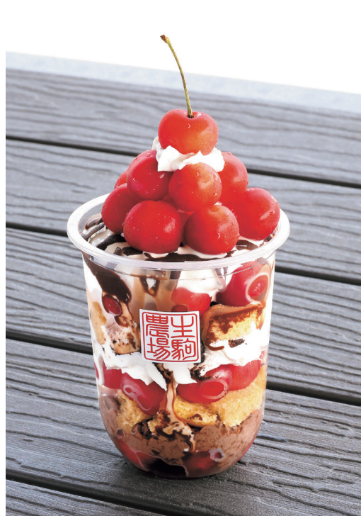
さくらんぼたっぷり!6月の「さくらんぼパフェ」