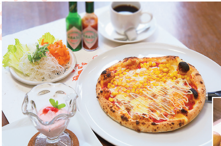
リーズナブルな「ピザランチセットA」。具材はツナマヨ&コン