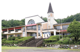
旧支倉小学校校舎を再生利用した可 愛い建物

川崎町大字支倉字塩沢9 (イーレ!はせくら王国) TEL.0224-51-9131 月～金、日曜 10:00～18:00 土曜 10:00～21:00(L.O.20:00) 火曜定休 ※火曜が祝日の場合は翌日休