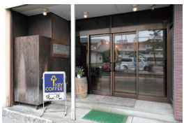
可愛いピーナッツのロゴと木製の樽が目印

ピーナッツプレス 川崎町大字前川字裏丁189-3 TEL.0224-84-2526 13:00~18:30 火曜定休 ※日曜不定休