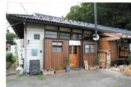
お茶屋さんの風情漂う平屋の一軒家

ちゃほ ぶくのはどう 川崎町大字前川字裏丁81-1 TEL.090-8053-1223 木・金・土曜 11:00~17:00 日~水曜定休