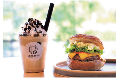
川崎産の卵を使用した「背徳感のチーズ&ハンバーグエッグ サンド」と「ツネナガシェイク」