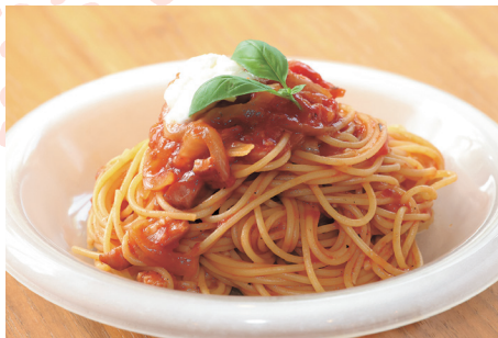
「ポモドーロ」に蔵王モツァオのモツアレチーズをのせて