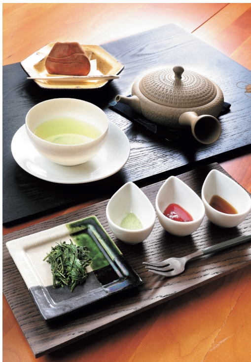
「本日の温かい上煎茶」。飲んだ後に茶葉を食べると、お茶の旨味をより味わえる