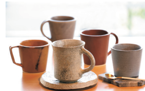
一点ものの器で 味わうコーヒー