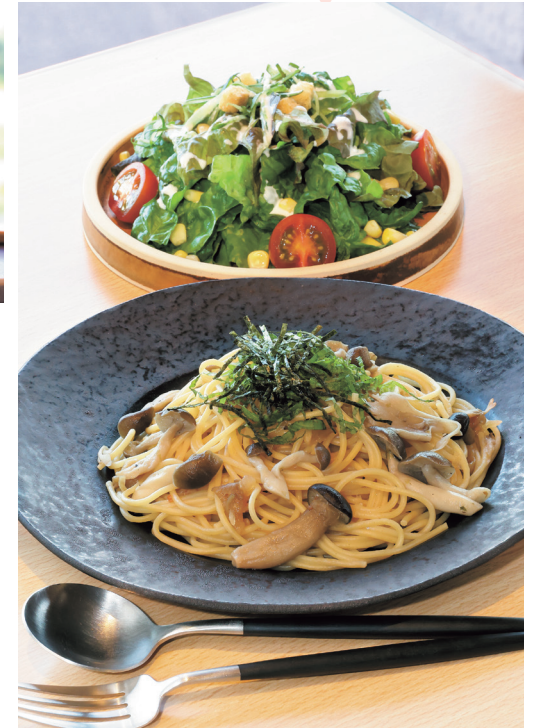
「和風しょうゆきのご pasta と季節のサラダセット」。サラダには自家栽培した 野菜を使う