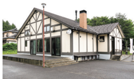
英国チューダー様式の外観が印象的

川崎町大字前川字北原22-9 TEL.0224-85-1656 11:00~16:00(L.O.15:30) ※パンの販売は9:00~ 売り切れ次第終了 土・日曜・祝日定休