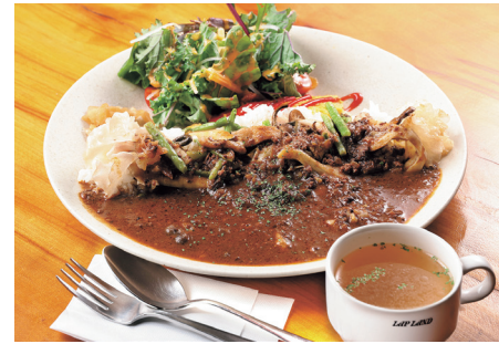
ワインで蒸したキノコと季節の山菜が豊富な「山賊カレー」