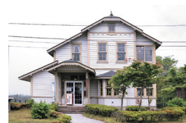
名旅館の歴史と面影を伝える建物