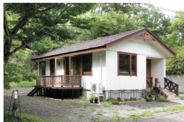
青根温泉サバトの森に佇む一軒家

川崎町大字前川字手塚山2-18 TEL.0224-87-8438 土曜 11:00~17:00(L.O.16:30) 日曜 10:00~17:00(L.O.16:30) 月~金曜定休 ※平日は完全予約制(2名以上)