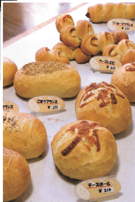
噛みごたえがあるハードパン。ベーコンエビなど種類が豊富