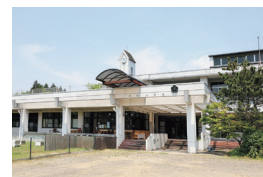
懐かしい学校の雰囲気が漂う建物

カワウチ カフェ 川崎町大字川内字天神前257-1 (旧川内小学校) TEL.0224-87-8727 11:00~17:00(L.O.16:30) 月・金曜定休 ※ドッグパークは10:00~