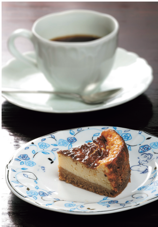
「Bセット」。濃厚で深い味わいバイクドチーズケーキとコーヒー「マイルド」