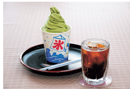
大自然が育んだおいしい水で作ったかき氷にアイスのをせて