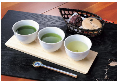
濃緑茶、嬉野茶、上煎茶の「飲み比べセット」と「しずく茶最中」