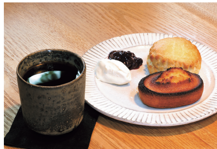
素材の良さが味わえるフィナンシェとしっとりしたスコーン