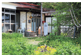
物語のプロログのような趣ある外観

川崎町大字川内字佐山11-1 TEL.0224-88-9019 月・木・金曜 10:00~17:00 土・日曜 12:00~17:00 ランチ 土・日・月曜 12:00~14:00 ※限定6食 火・水曜定休