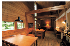
木のぬくもりと温かい照明に心がほぐれる