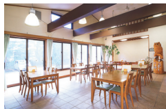
冬は薪ストーブが活躍