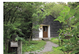
森の中の倉庫をイメージした建物

ブルーコーヒー 川崎町大字前川字手塚山1-363 TEL.0224-87-2881 11:00~18:00 木・金曜定休 ※1・2月は土・日・祝日のみ営業