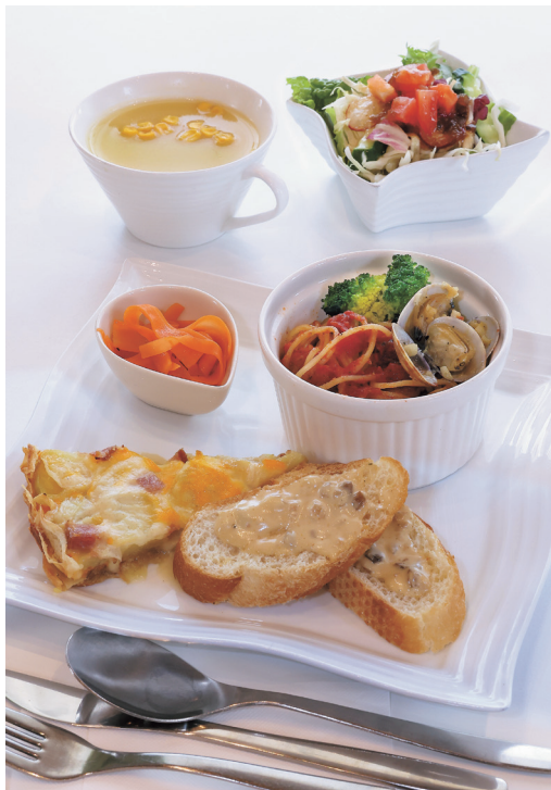
「キッシュとトマトソースパスタランチ」はドリンクとミニスイーツがセットで付く