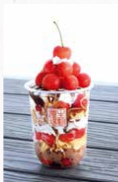
「八百屋の本気パフェ」(1,200円)はボリューム満点、お手ごろ価格で大人気。旬のフルーツを惜しみなく、どっさり使っている(写真は6月に提供された「さくらんぼパフェ」1,500円)

杜の湖畔公園そばの八百屋&カフェ。濃厚ソフトに旬の果実を盛った名物「八百屋の本気パフェ」は絶品で、リピーター続出。