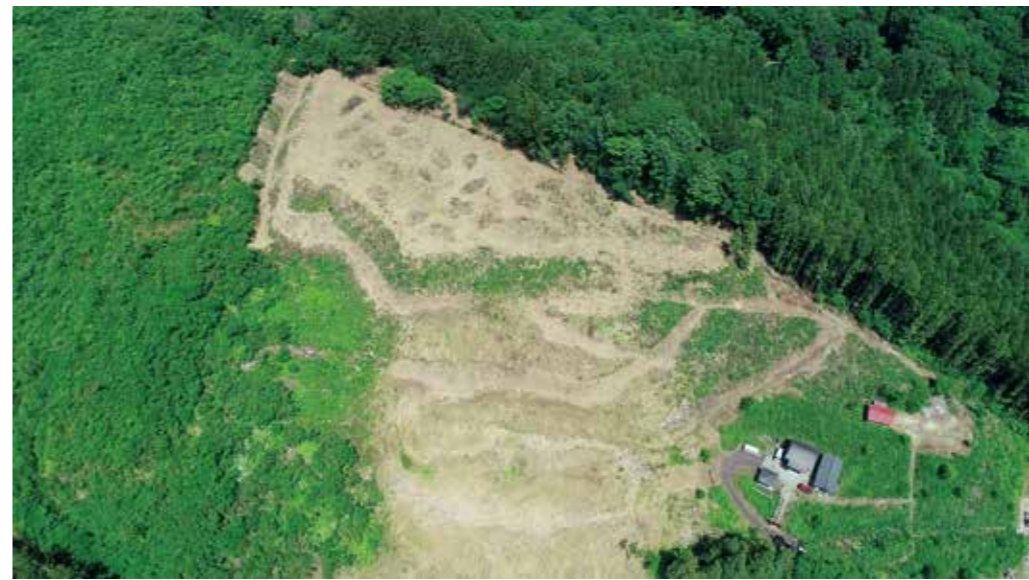
川崎町小野字笹平山