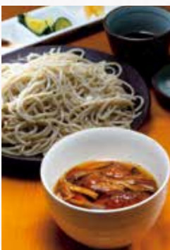
コシがあり、そば本来の甘みが味わえる寒ざらしざるそば(1,200円)。秋のイチオシが、温かいきのこ汁(500円)とのセット。旬の風味たっぷり、奥深い味わいにほっこり

一般的に期間限定で提供される寒ざらしそばを、川音亭では通年食べられる。自家栽培された野菜の天ぷらと一緒に召し上がれ。