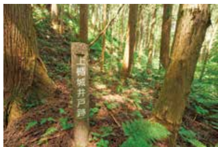
当時大勢の人々が暮らしていたことを実感できる井戸跡