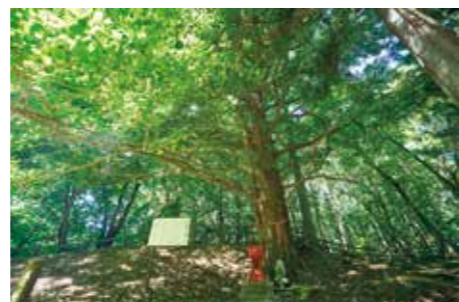
本丸跡には大銀杏がそびえる。根元に小さな赤い祠が鎮座。これが「八幡神社」だ

る虎口があり、二段のコの字の土塁が築かれている。同じように横堀が巡る二の丸も、一部に土塁が。三の丸はやや荒れているものの、東側に横堀が見られ、南は堀切により遮断されている。不思議なことに、攻め入る敵を