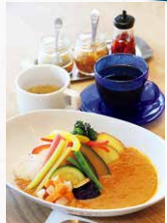
「イーレ」はスペイン語で「行こう」という意味。カフェ・マルでは、自家焙煎のコーヒーで風味の違いを楽しむ。「温野菜のセカレー」(1,000円)。