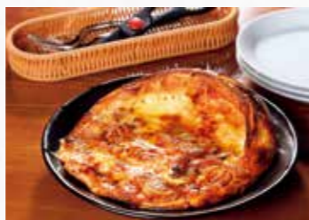
人気ナンバーワンの「蔵王のお釜ピザ」(1,857円)は蔵王で採れた良質な牛乳で作ったチーズをたっぷり乗せて、ふわふわもちもち。クセになる美味しさだ

食材と手作りにこだわったピザ工房。蔵王山麓の美味しい水で練り上げ、低温長時間発酵させたピザ生地は小麦の香ばしさが抜群。