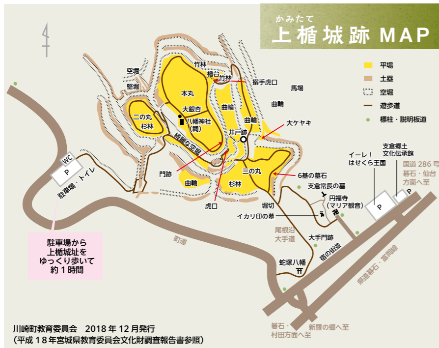
川崎町教育委員会 2018年12月発行 (平成18年宮城県教育委員会文化財調査報告書参照)

本丸は広く、西に土塁が築かれ、空堀がぐるりと取り囲む。中央はうっそうと杉木立が生い茂る。明治以降、本丸は長らく畑として利用されていた。やがて持ち主が畑作をやめられ、杉の木を植林。現在の光景に生まれ変わった。びっしりと城跡を埋め尽くし、整然と並ぶ様は杉の回廊のようだ。本丸の北東側にも注目。二重の空堀となっている。ここに通じ