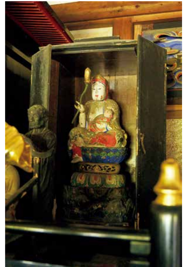
通常非公開のマリア観音像を、りらく読者のために特別公開

五輪塔はいつ建てられたか定かではない。苔むして、風化により文字が磨滅し、ほとんど読解不能に。それによりかえってミステリアスな度合いがアップしている。