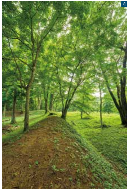
川崎町大字前川字本城

よって戦い、この柵が地名を取って「中ノ内城」と呼ばれた。戦国末期の天正年間1573年頃、砂金氏八代常久が築城。1609年頃、十一代常房が前川城に移転するまで居城した。居城期間は36年間と短く、後廃城となった中ノ内城は「本城」と呼ばれるようになり、周辺の地名となった。