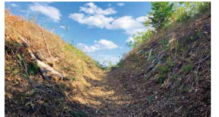
西側に位置する郭には大きな土塁と空堀が。V字形に掘られた薬研堀の傾斜はキツく、深さが6mもある

小野城は東西250m、南北180m。東郭と西郭に大きく二分される。それぞれが周囲に曲輪群と土塁、空堀などの防御設備を持ち、東の南側に大手、北中央付近に搦め手の虎口、また南山腹に二の丸があった。主郭の西から北にかけて土塁が巡り、北下には空堀から続く通路が搦め手虎口まで続く。