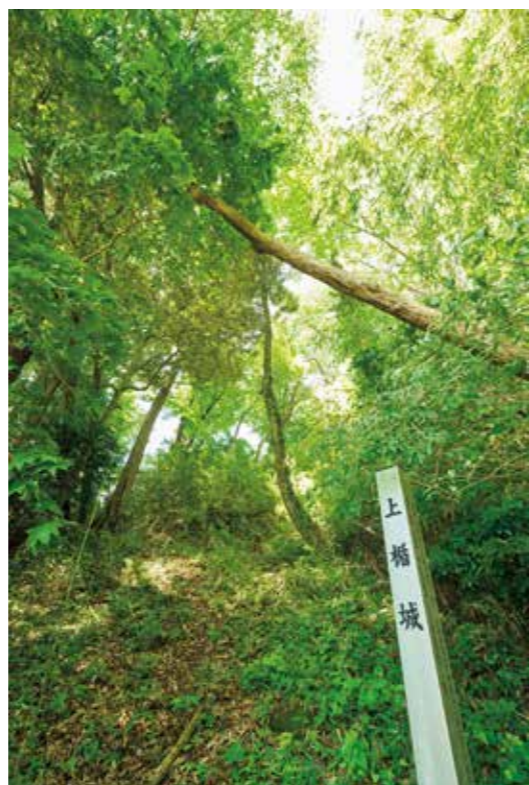
所々に倒木だけでなく、倒木予備軍の樹木も。散策する際はくれぐれも足元に気を付けて