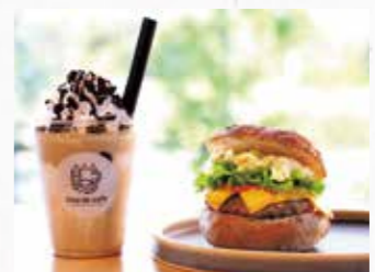
川崎町産の卵を使用した「背徳感のチーズ&ハンバーグエッグサンド」(1,380円)と「ツネナガシェイク」(850円)

Ono de cafe (オノデカフェ) 支倉常長にちなむブレンドや本格シングルオリジンに加え、白砂糖やマーガリンを使わない焼き菓子や濃厚ツネナガシェイクも楽しめる。