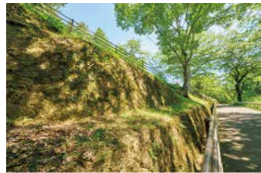
城山公園を下った側面の石垣は昭和初期に造られたものだそうだ

し、21城あったうちのひとつが、ここ。川崎町の町名は川崎城(川崎要害)に由来する。ちなみに要害は城だけでなく、必ず町場・宿駅などの城下町を持つ。地域経済の中心として機能した。現在城山公園となっている場所が本丸、川崎小学校が二の丸だった。東南部に大手門口、北面に搦め手も。東西100間、南北40間のエリアには土塁や空堀も一部残っている。城跡周辺の町割りも、ほぼ当時のままだ。ところで、町内には前川城とは別に前川本城がある。川崎要害の「前身」という意味で中ノ内城がそう呼ばれるようになった。