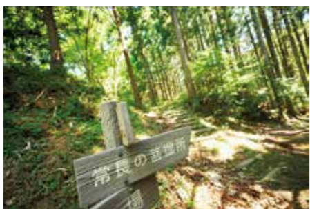
丘陵を下った先に支倉家の菩提寺・圓福寺がある 川崎町大字支倉字鶴山

イメージするだけでも武者震いが出てくる。それくらい臨場感たっぷり。荘厳な雰囲気の中、戦国武将が郷を愛し守るために、知恵を絞った戦術が浮かび上がってくるからだろうか。