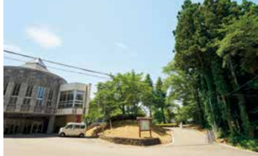
弱め手より向かって右が本丸、左が二の丸だった。現在はそれぞれ城山公園、川崎小学校になっている