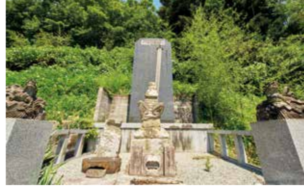
支倉常長の墓と伝えられる宝篋印塔。若かりし日の常長が目にしたであろう平野を一望できる場所に立つ

開創は平安時代後期。明治初期、真言宗智山派の直末寺として現在地に中興開山した。塑像の延命地藏菩薩が本尊。身の丈3尺(約90cm)あり、平安時代の作と伝えられる。脇仏にマリア観音像が置かれ、仏像に模していることから隠れキリシタンに由来するものとされる。ご存じの通り、支倉常長は藩主・伊達政宗の命を受けて、慶長遣欧使節としてイスパニア(スペイン)へ。帰国後は支倉の地に安住し、52年の短くも、波乱万丈の生涯を閉じたといわれる。圓福寺本堂裏手の斜面には支倉常長の墓と伝えられる宝篋印塔が残る。ほかにも鐘印の付いた墓跡も3基あり