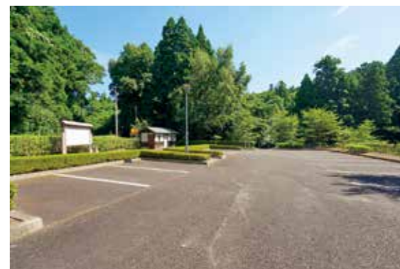
上楯城跡の駐車場。トイレあり

上楯城跡までは圓福寺の駐車場から登るほか、山頂付近に駐車場が整備されている(写真右)。