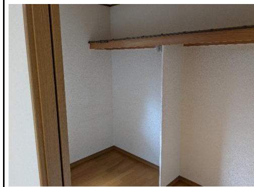
2階洋室①クローゼット